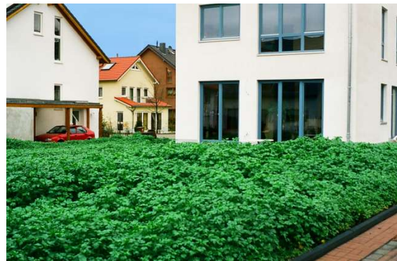
Regeneration baulich beanspruchter Gartenböden mit einer Zwischenbegrünung, hier Senf vor der Blüte.

Falls die Böden trotz aller Vorkehrungen verdichtet wurden, müssen sie fachgerecht bis in die Verdichtungszone gelockert werden. Auch bestehende Schäden aus Vornutzungen sollten gezielt beseitigt werden.