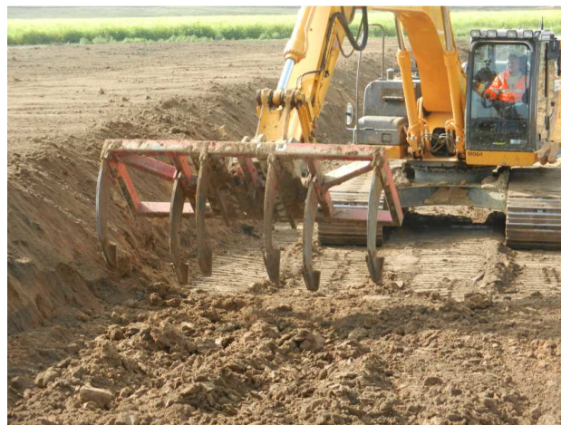
Lockerung des Planums vor Bodenauftrag mit Tiefengrubber. Ein Wechsel zwischen Baggerlöffel und Tiefengrubber ist mittels Schnellkupplung leicht möglich.