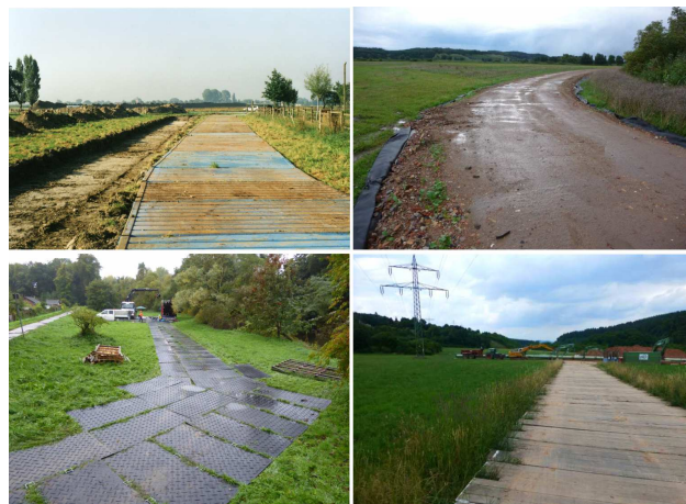
Auswahl geeigneter Befestigungssysteme.