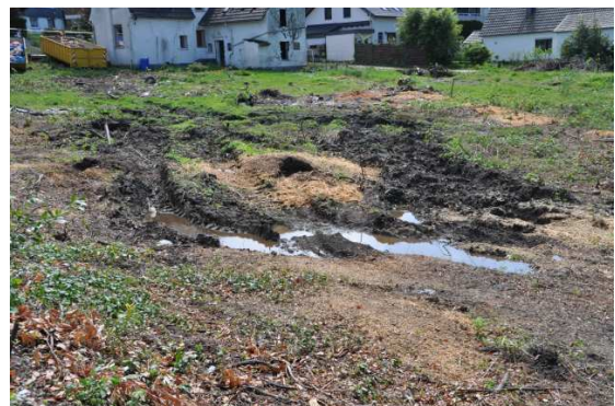
Bei der Baufeldfreimachung stark verdichteter Boden mit tiefen Fahrspuren. Hier wurde keine Vorsorge betrieben.

Diese rechtlichen Pflichten spiegeln sich auch in verschiedenen fachlichen Normen zu Boden-